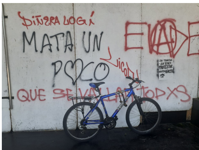
Figura 5. Muros y graffitis. Plaza Dignidad, noviembre 2019.