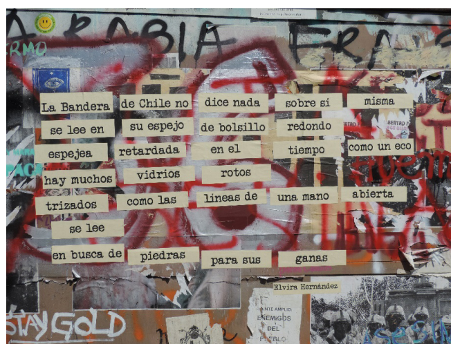
Figura 6. Textos en muros del entorno de Plaza Dignidad.

fantasmagóricos. El secreto mejor guardado por la industria del patrimonio nos señala Gordillo (2018) es que sus ruinas son escombros que han sido fetichizados. En Chile, la revuelta social los ha delatado. Estas disputas son un buen ejemplo de cómo el fetiche y sus desplazamientos significantes están históricamente situados y, por ende, irremediabilmente participan de campos de intereses en pugna.