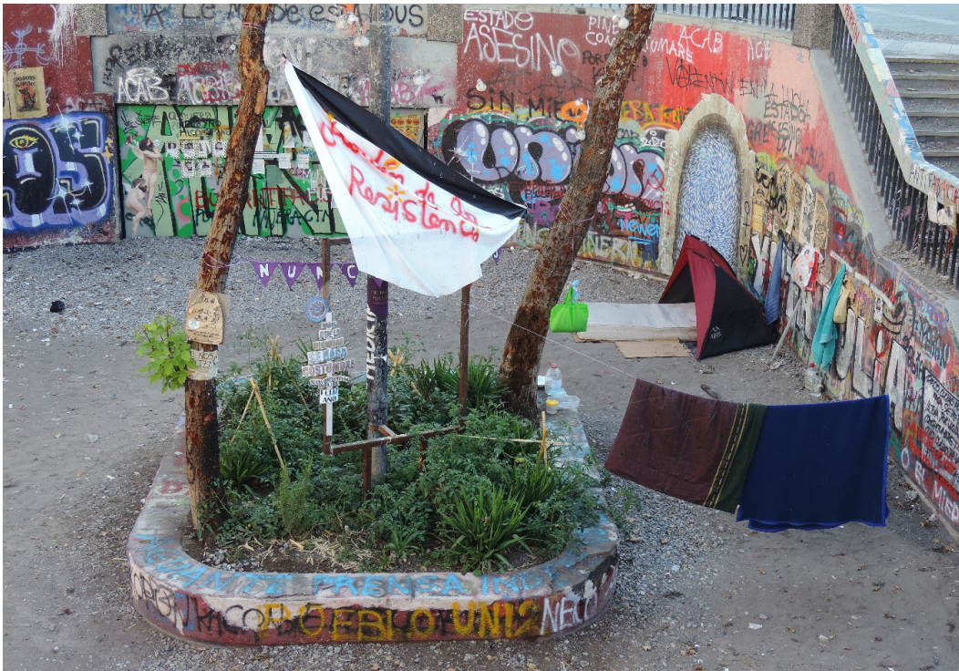
Figura 10. Jardín de la Resistencia, Plaza Dignidad, Santiago.

en este jardín, adornado con cintas de colores, enaguas blancas bordadas con los nombres de las mujeres muertas o los ojos de los mutilados, entre los escombros de la plaza se crean nuevas formas de evocación, afectivas y no discursivas. Son las figuras fantasmagóricas que rondan por el entorno (Espinoza, 2019; Gordillo, 2018) obligándonos a aprender a convivir con ellas. Tal como señala Navaro-Yashin (2009), los objetos derruidos liberan energías emotivas; en especial, para quienes habitan u ocupan los entornos. En estos términos, todo proceso de ruinización o ruina (Errázuriz y Greene, 2018), entendido como material o artefacto objeto de destrucción o violencia, gatilla subjetividades y afectos residuales.