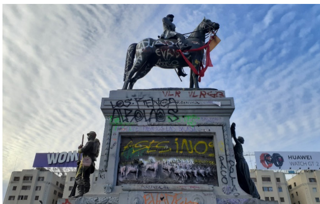
Figura 7. Escultura de Manuel Baquedano, Plaza Italia, Santiago, octubre 2019.

de los escombros se vuelve caminable, obligatoriamente caminable, porque ni el metro que ardió, ni los buses seriamente averiados, logran trasladar a los miles de pasajeros transformados de un día al otro, en peatones.