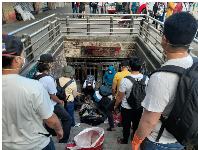
Figura 11. Jóvenes evangélicos limpiando el metro Baquedano, Plaza Dignidad. Domingo de noviembre 2019.

Dos, encantarse con la ambigüedad de la forma: en estos días de revuelta hemos aprendido que lo abyecto y distópico puede volverse tan parte de nuestro paisaje, que resulta difícil pensarse sin ello. Con esto no se niega el poder desestabilizador del escombro, del peñasco extraído de la vereda por jóvenes encapuchados. Los escombros, lejos de tranquilizarnos con certezas, se mueven en el plano de lo indeterminado y de lo ambiguo; de aquello que se convoca, pero no se nombra de forma explícita. Los escombros no pertenecen a nadie porque nos hablan de tiempos múltiples, circulares y superpuestos como capas (Augé, 2003). Aceptar que la plaza permanezca polvorienta y escombrosa es abrirse también al encanto del desplazamiento, de la fricción de la paradoja y las heterotopías, para que desde allí se construya un acuerdo de ocupación diversa y champurrea, donde todxs quepamos. Más que