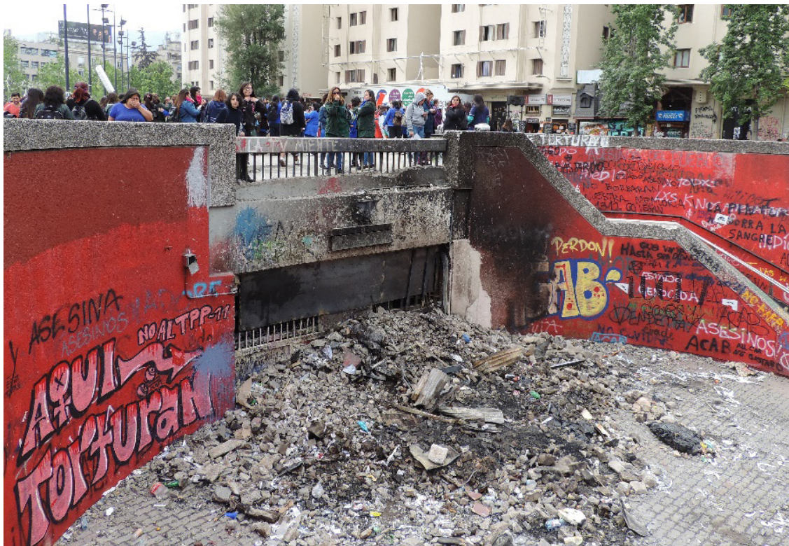
Figura 1. Escombros metro Baquedano: "Aquí torturan". Santiago, octubre 2019.

Una segunda premisa señala que la clave de este proceso de desestabilización no está en la condición de artefacto ruinoso o derruido que el estallido social deja tras de sí, sino en los procesos iterativos de desplazamiento del escombro al artefacto reconstruido y del artefacto reconstruido al escombro. En este proceso de destrucción y reconstrucción iterativa, se movilizan y entrelazan agencias históricas y culturalmente situadas. Es en esta temporalidad de la historia y de la memoria, que la especificidad de la destrucción de un sistema que se quiere borrar, hace su aparición. En este ir y venir, tanto la historia como la cultura participan desde una densidad significativa, dejando espacio para la participación de la