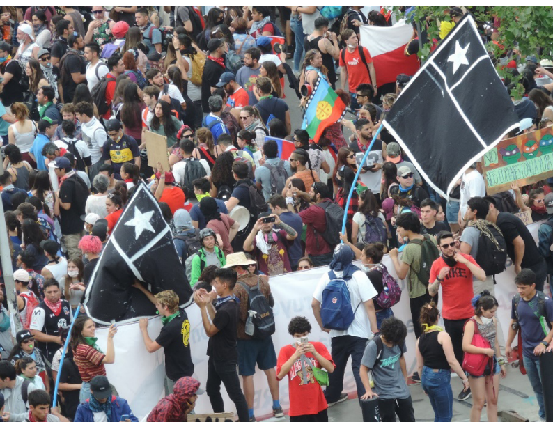
Figura 2. Jóvenes y banderas negras en Plaza Baquedano, octubre 2019.

imaginación, la magia de la mimesis y los sentidos sobre esta materialidad (Taussig, 2002). De allí la importancia de observar los escombros del estallido social como aquellos nodos/confluencia e hitos/referentes urbanos (Lynch, 1965) críticos donde convergen los cuerpos, los bienes, los dioses, el arte, las leyes, los antepasados, los animales, las creencias y las ideologías (Ingold, 2000).