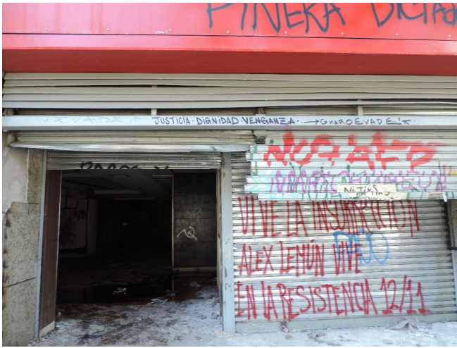
Figura 4. Banco saqueado. "Justicia. Dignidad. Venganza. Evade/ Vive la insurrección. Alex Lemún vive en la resistencia 12/11".

(re)pensarlo y develar su espesor significativo. Como las sillas del restaurante saqueado que luego se transformarán en material de barricadas; o los bancos de madera de las iglesias que luego arderán como hogueras; o las tapas de alcantarillado que manos hábiles transformarán en escudos para los jóvenes de la primera línea .