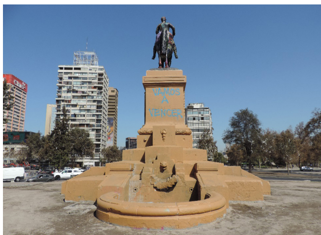
Figura 9. Monumento al general Baquedano limpiado de madrugada por las autoridades, pero tempranamente contestado por manifestantes: “Vamos a vencer”. 19 de marzo 2020.

Los vidrios quebrados y las veredas rotas como estorbos estéticos y del “tiempo homogéneo” de la ideología del progreso (Gordillo, 2018), irrumpen nuestro deambular por la ciudad obligándonos a salir de nosotros mismos y así reconfigurar los hábitos y resetear las emociones. Son los escombros del estallido que increpan y compelen a leer la forma histórica material y fenomenológica de aquellos objetos, arquitecturas y paisajes que creíamos dados. Asimismo, la vida como la caminata continúan. En este aprovechar y valerse de los escombros inútiles (Ginsberg, 2004), nuevos significados y afectos comenzarán a encontrar su lugar para desplegarse.