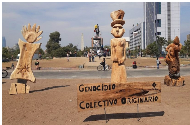
Figura 8. Museo a cielo abierto.

Los escombros de la revuelta nos obligan entonces a ser cuerpos sintientes, perceptuales, para dejar que la cinestesia opere y oriente en el desorden. En esa caminata cuidadosa por los escombros, los cuerpos se reconocen, hablan, se ayudan, se sonríen, entre miradas cómplices y cansadas. Si no fuese por esa conversación, caminar por un campo de escombros podría significar caminar por un campo de desolación, de vacío y pérdida. Las atmósferas y paisajes creados por los supermercados, bancos y estaciones de metros destruidos expresan misterio, tormento, violencia y extrañeza. Calles desoladas, sembradas de peñascos y escombros donde, sin embargo, el afecto y la emoción se despiertan y se transmiten (Navaro-Yashin, 2009; Stoetze, 2018). Es el desasosiego, a ratos insoportable, que suscitan estos lugares derruidos y que, no obstante, continúan sirviendo como escenarios de vida (Simmel, 1988).