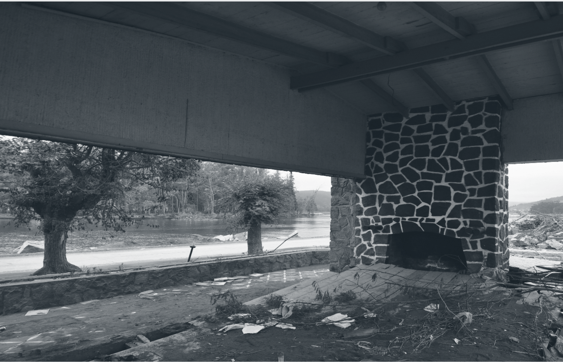
Constitución. Marzo de 2010.