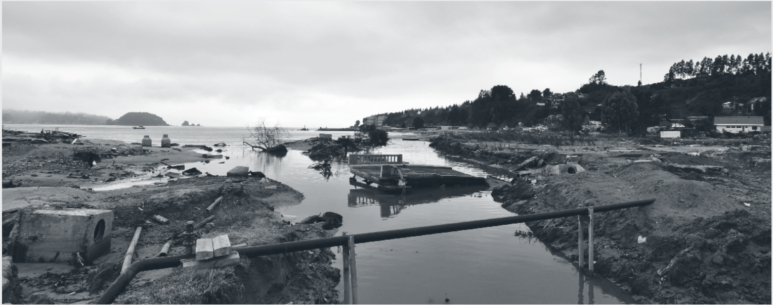
Dichato. Abril de 2010.