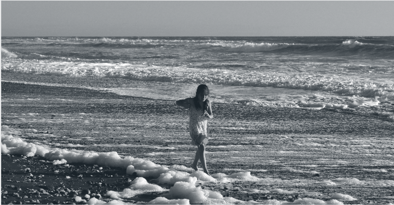
Constitución, Febrero de 2010.