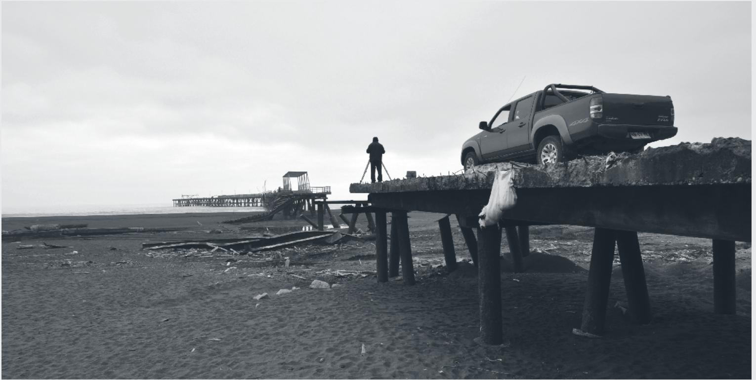
Constitución. Marzo de 2010.