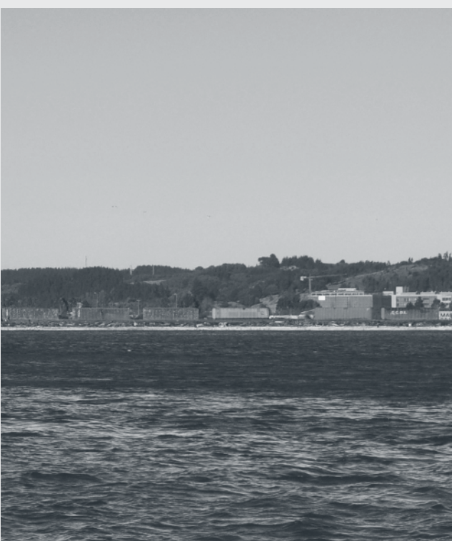
Talcahuano. Abril de 2010.