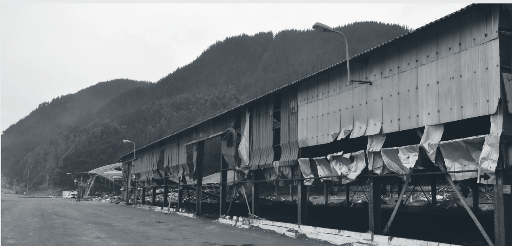
Puerto de Constitución. Marzo de 2010.