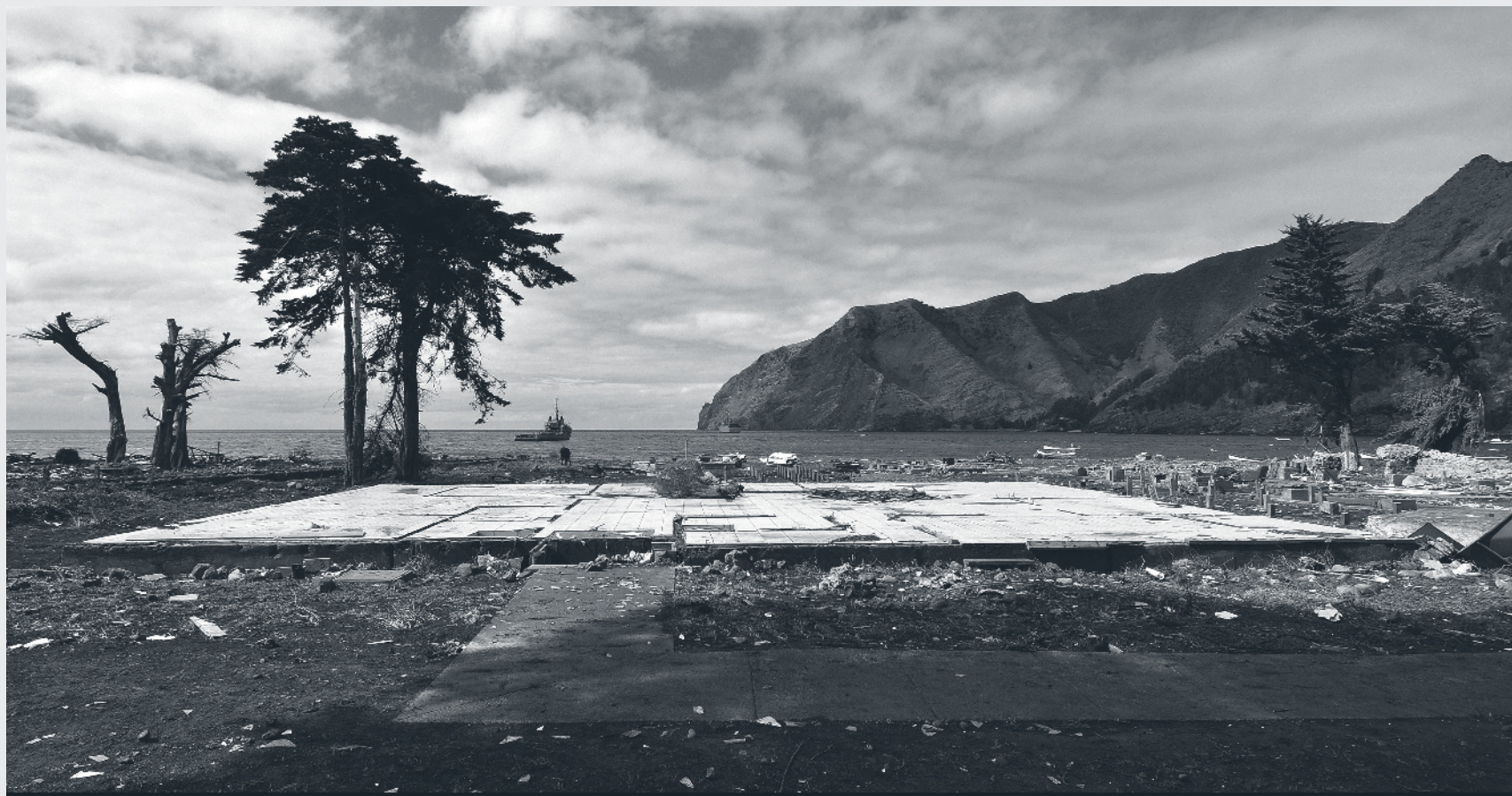
Bahía de Cumberland, isla Robinson Crusoe. Abril de 2010.