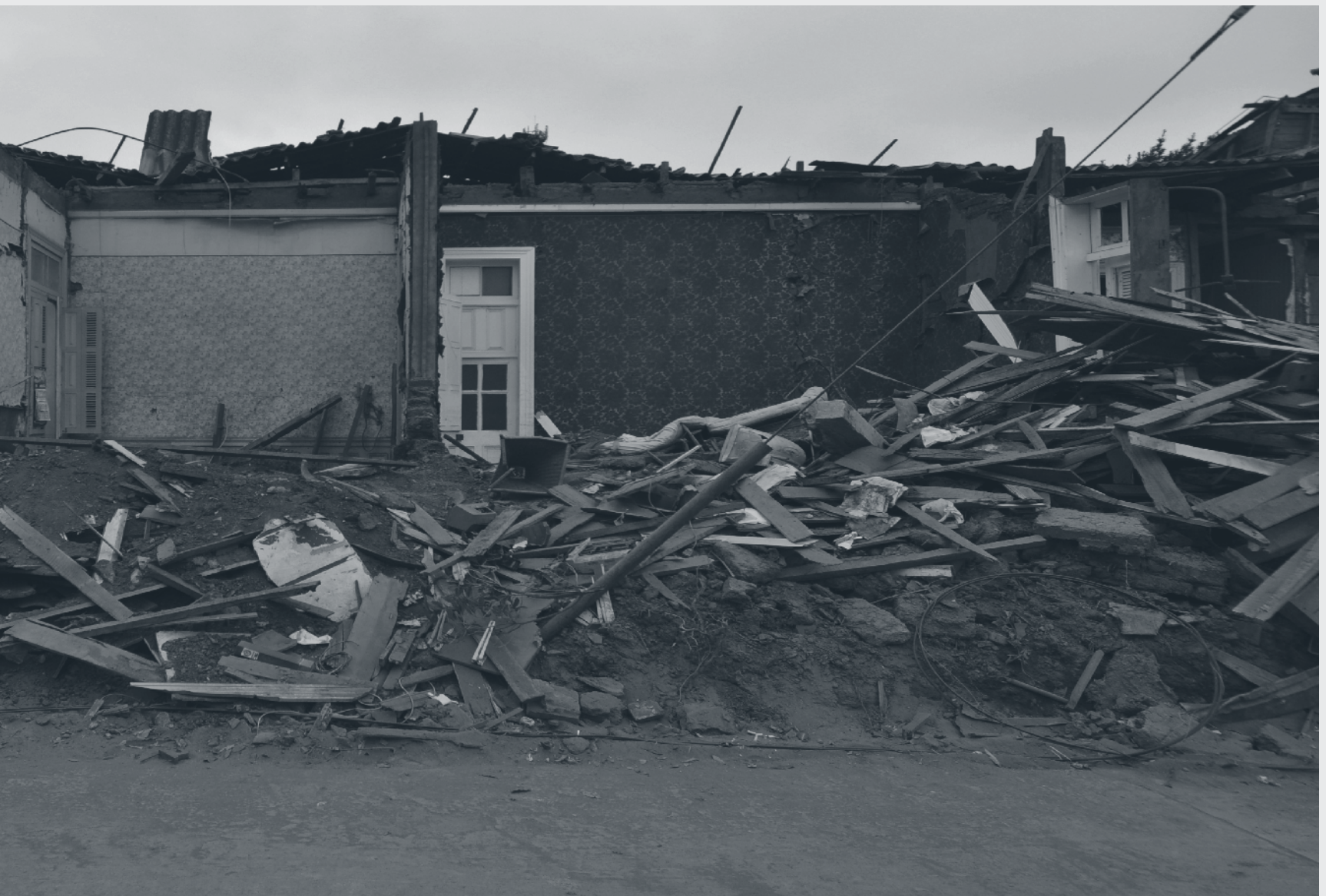
Constitución. Abril de 2010.