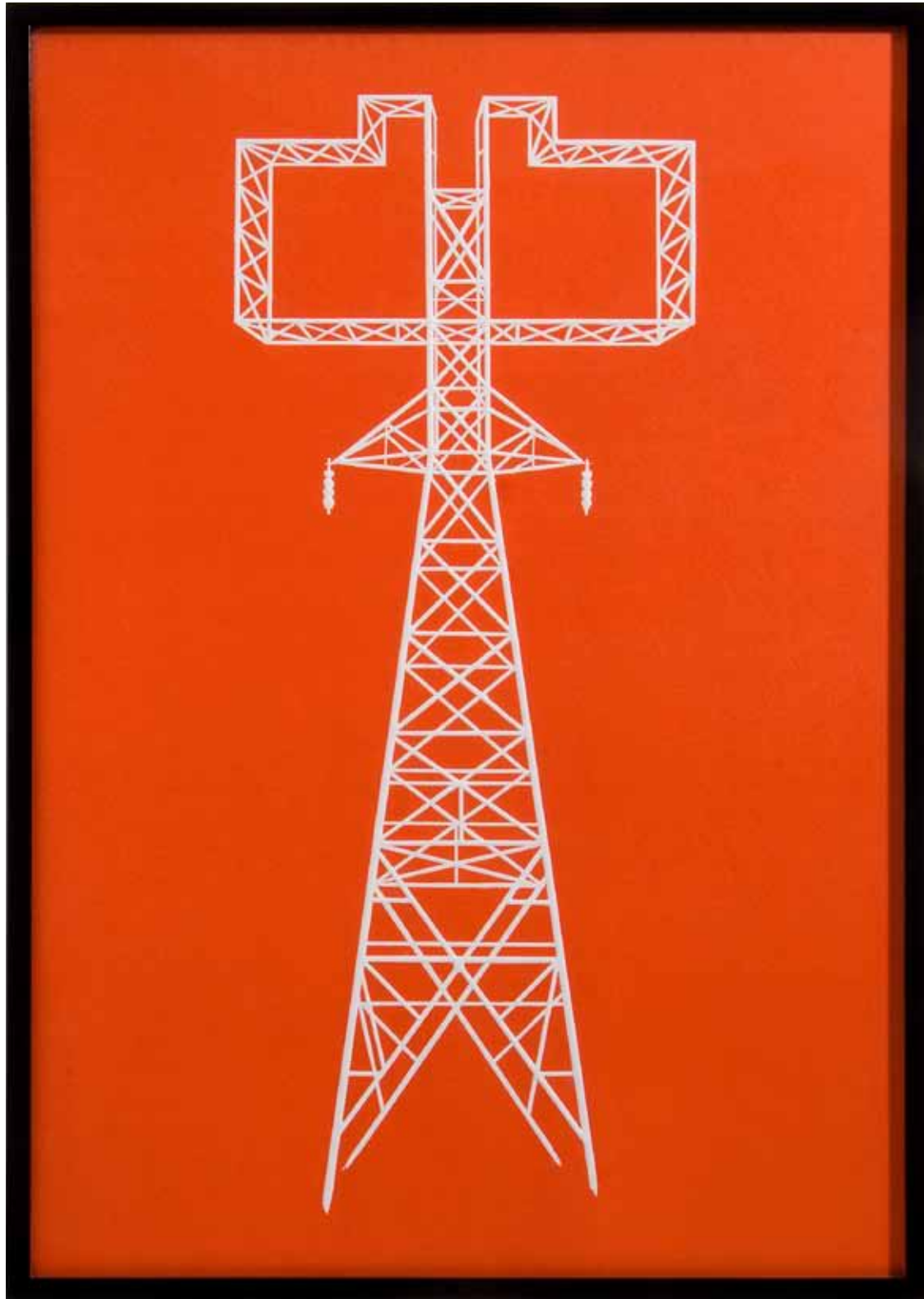
Título: Serie Paisajes en Reserva Xilografía / Gofrado, edición de 5 copias Dimensiones: 1,00 x 0,70 metros Año: 2009.