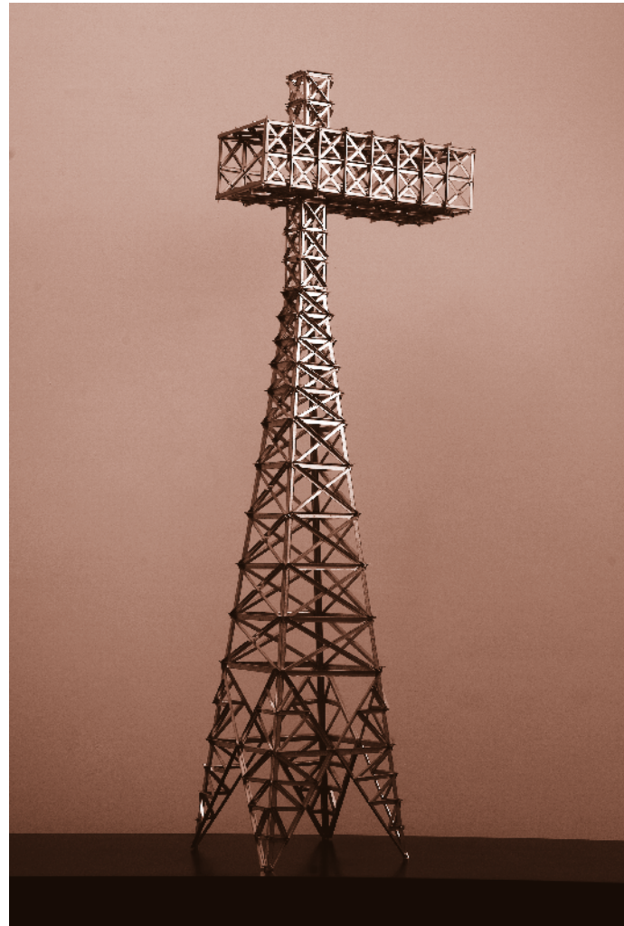
Título: Serie Paisajes en Reserva Estructura de hojalata plegada, pernos milimétricos. Dimensiones: torre de la izquierda 0,35 x 0,35 x 1,25 metros. torre de la derecha 0,32 x 0,32 x 1,30 metros. Año: 2009.