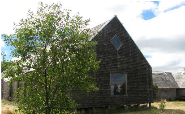
Figura 6. Museo de Arte Moderno MAM de Chiloé. Arquitecto Edward Rojas.