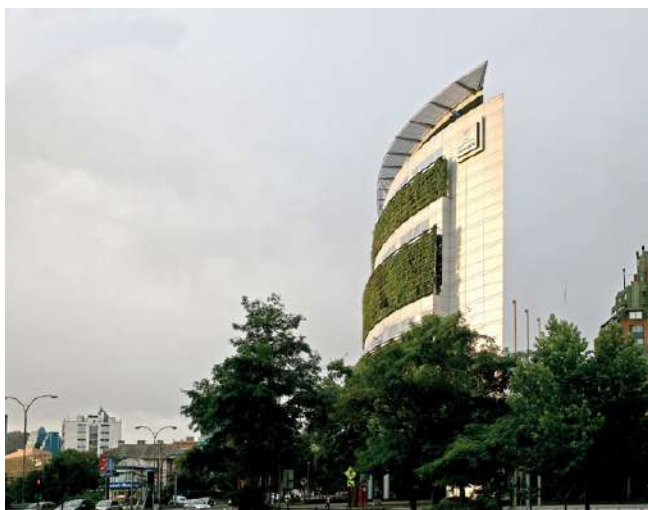
Figura 4. Edificio Consorcio, Santiago. Arquitectos Enrique Browne y Borja García-Huidobro.