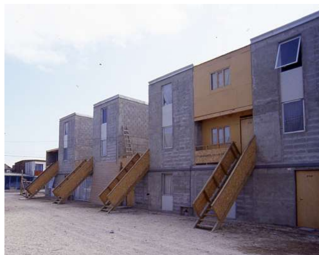
Figura 5. Quinta Monroy, Iquique. Arquitectura de Elemental.