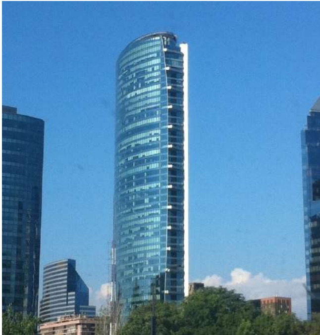
Figura 8. Torre Titanium, Santiago. Arquitecto Abraham Senerman.