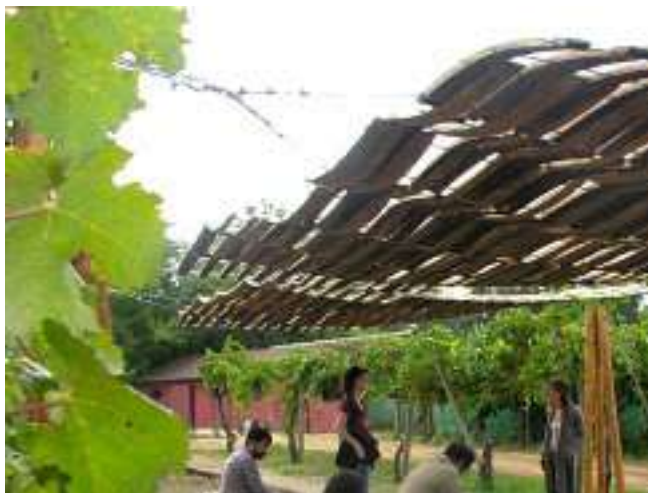
Figura 7. Descanso en los Viñedos, San Clemente. Arquitecta Macarena Ávila.