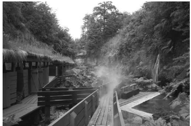
Figura 3. Termas Geométricas, Villarrica. Arquitecto Germán del Sol.