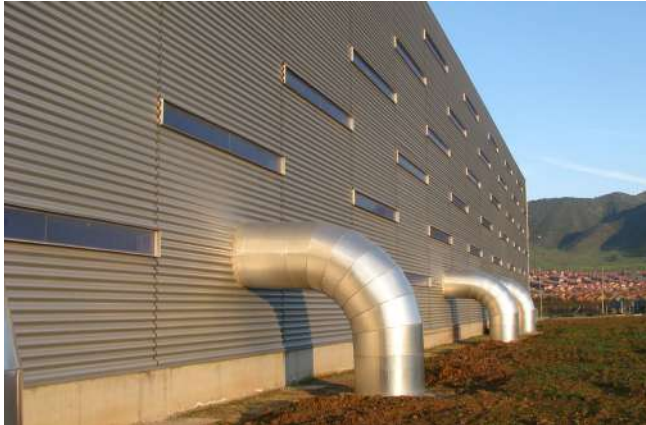
Figura 9. Edificio FASA, Santiago. Arquitecto Guillermo Hevia.

Es interesante observar que la cantidad de obras publicadas que responden a criterios de imagen técnica sufre un notable aumento en los años 2012 y 2013, cuando muchas se describen según sus atributos de certificación LEED, especialmente aquellos asociados al ahorro de energía y agua.