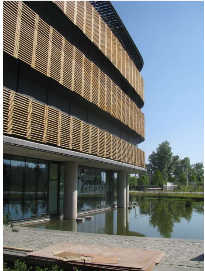
Figura 10. Edificio Transoceánica. Santiago + Arquitectos.

La revisión de las obras de arquitectura que han sido publicadas durante los últimos años bajo atributos de sustentabilidad, sugiere que no existe una imagen única