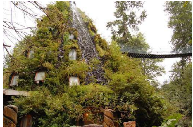
Figura 2. Hotel Montaña Mágica de Huilo-Huilo. Arquitecto Rodrigo Verdugo.

la vegetación como materialidad y forma construida. En Chile, destaca la obra del arquitecto Enrique Browne, quien a lo largo de su carrera ha intentado “devolver la naturaleza a la arquitectura” (Browne, 2016, p. 6), siendo pionero en crear la doble fachada vegetal en el edificio Consorcio de Santiago, referente icónico en esta materia (Figura 4). Browne considera a los elementos naturales, tal como vegetación y tierra, como materiales de construcción, por lo que estos elementos constituyen la expresión de sus obras, a través de dobles pieles vegetales, parrones y cubiertas verdes, que caracterizan la gran mayoría de ellas, desde el edificio del Consorcio en Santiago diseñado en la década de los noventa (Browne, 2008), hasta el edificio semienterrado del Centro de Minería Andrónico Luksic (Browne, 2015).